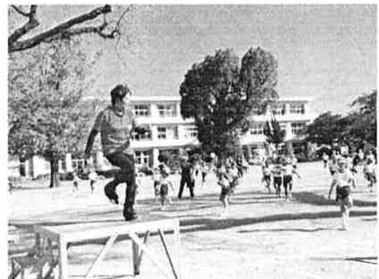
(市来小学校運動会練習風景)