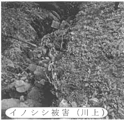
イノシシ被害 (川上)