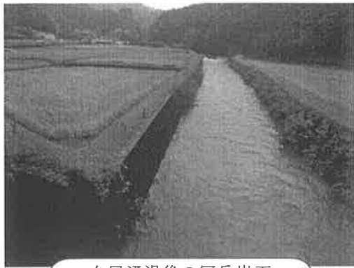
台風通過後の冠岳岩下

よしどめ…円安などによる資材高騰や輸入品の値上がり、調達不安など農業を取り巻く新たな状況の認識