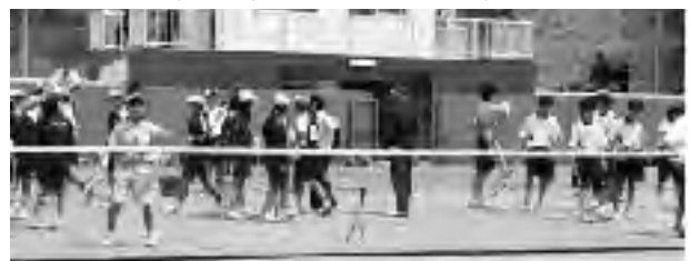
テニスコートでプレーする子供たち

庭球場の整備については利用者が増えて、所期の目的は達成していると思うが、将来的にトイレ設置を検討して欲しい。