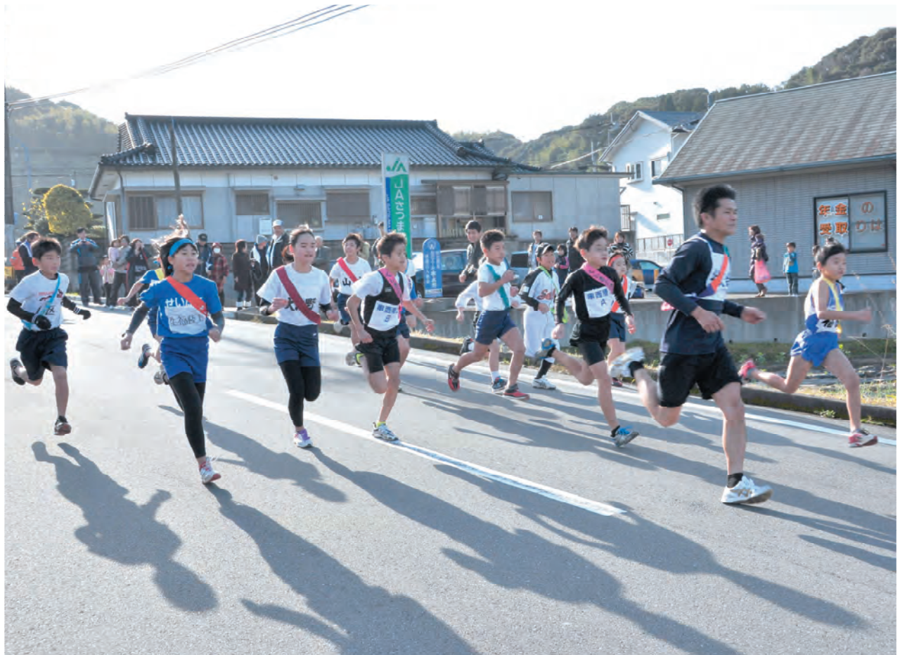
生福路を駆け抜ける(生福地区駅伝競走大会)……(P16に写真の説明)