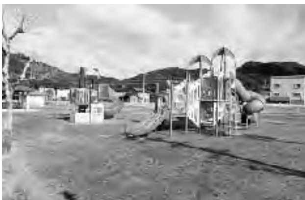
指定管理となる新開公園（麓）

大原公園、長崎鼻公園、照島東公園、郷之原第1公園、郷之原第2公園、郷之原第3公園、上馬籠公園、八久保公園、中道公園、湊中央公園、新田跡公園、永野原公園、出ル葉公園、中段公園、住吉公園、小水林間広場、 麓ふれあい公園 、 小城公園 、 権現下公園