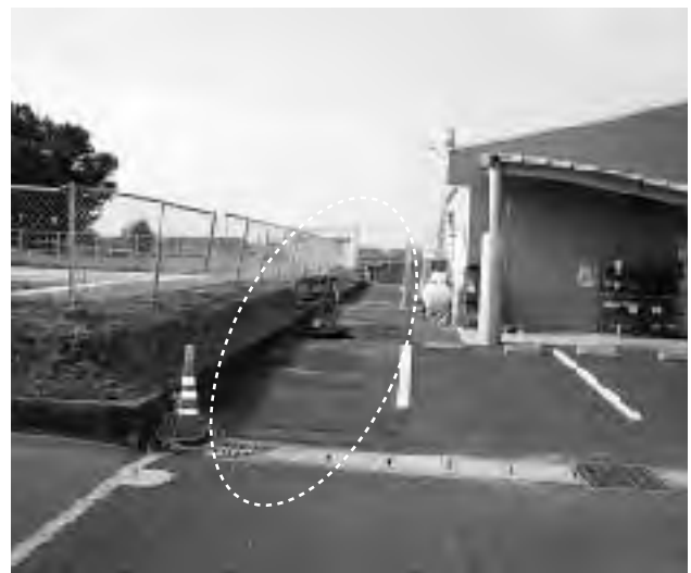
拡幅される市来漁港への進入路（えびす市場横）