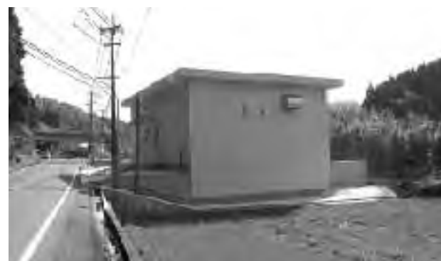
整備された川上ポンプ場

主な建設事業は、第6次拡張事業に伴う川上ポンプ場の築造、麓土地区画整理事業に伴う配水管布設及び布設替工事等