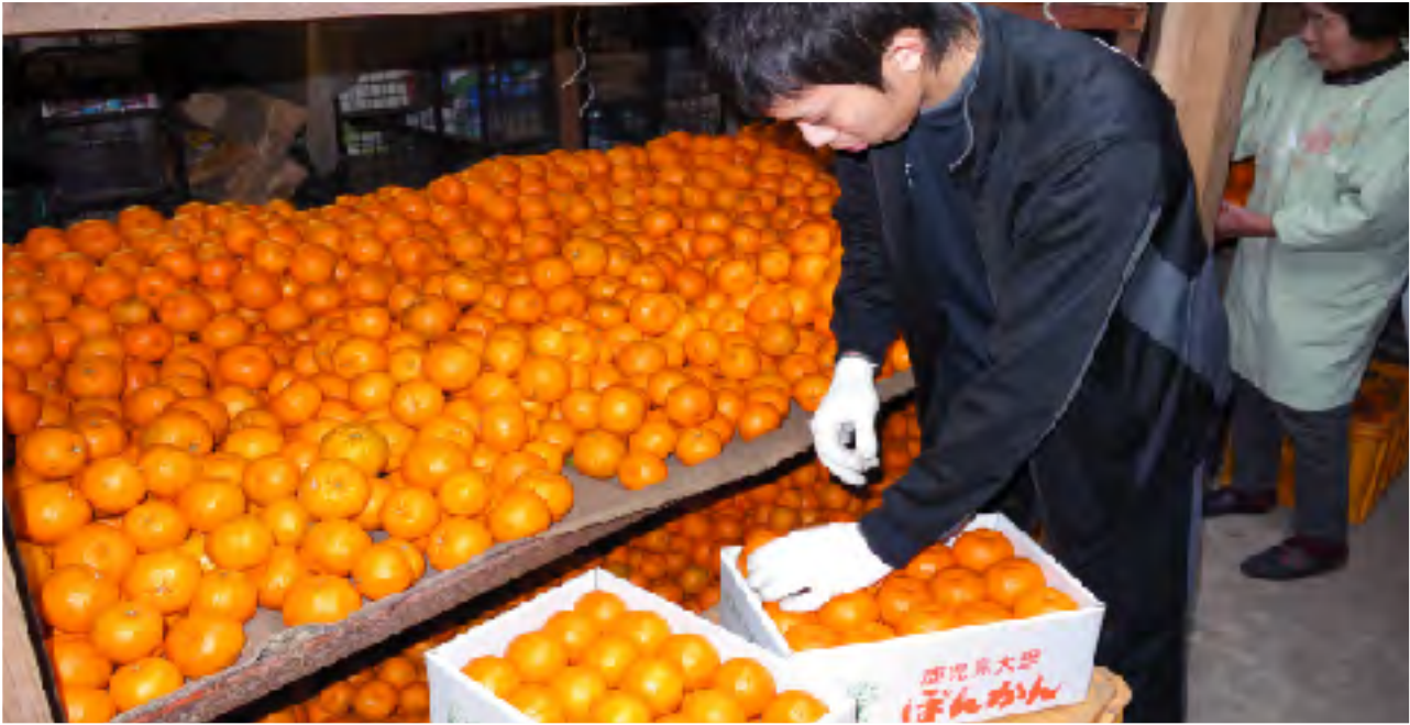
特産ポンカンの出荷作業に追われる生産農家