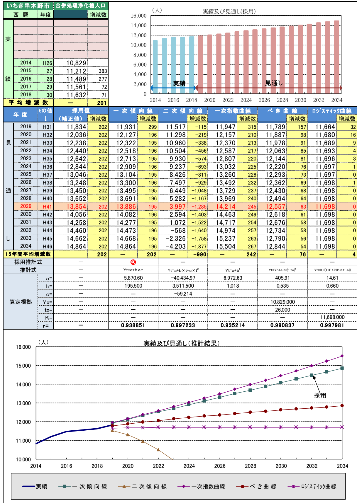
◆図表 3-1 合併処理浄化槽の推計結果