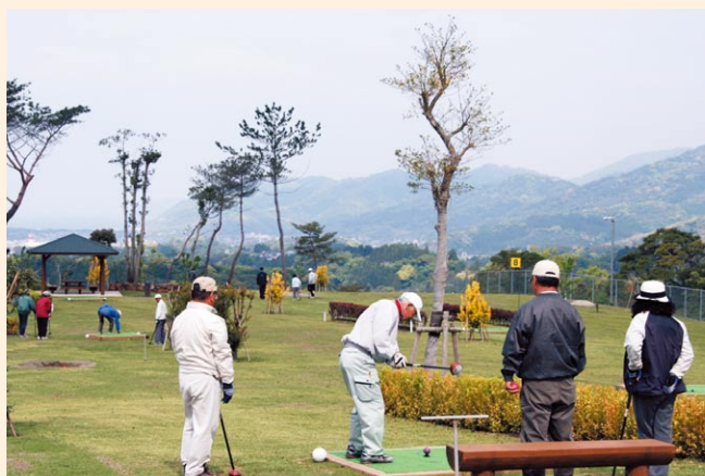
▲いちき串木野パークゴルフ場

そのためにも、依然として、極めて厳しい状況にある市の財政については、財政健全化計画に基づく財政運営を推進し、計画目標の達成に向けて、市長として自らが先頭に立ち、行財政改革に精力的に取り組んで参ります。