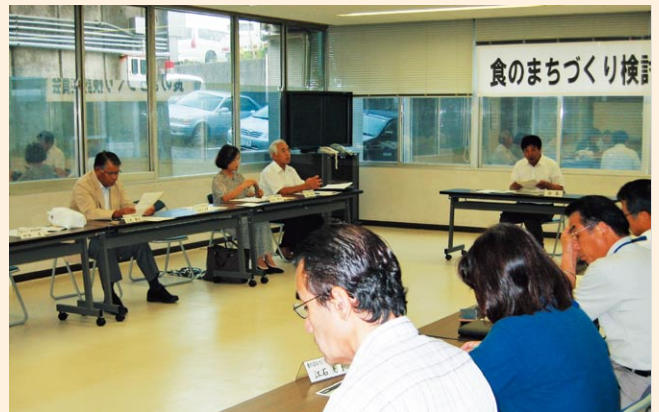
▲食のまちづくり検討委員会