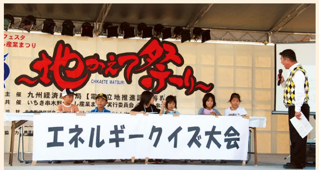
▲いちき串木野づくし産業まつり～地かえて祭り～

企業誘致の推進、食のまちづくり推進、商工業・観光の振興、農林水産業の振興、ほ場・漁港等産業基盤の整備など