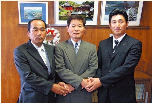
▲指定管理者調印式