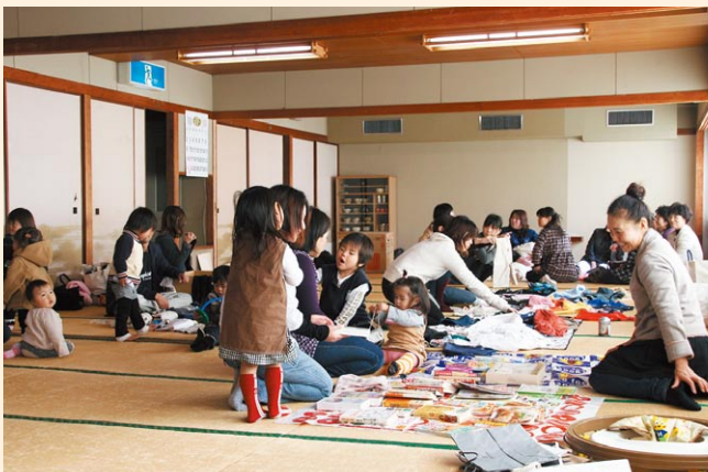
▲大原地区乳幼児学級「アンファン」

子育て支援体制の充実、定住促進対策の推進、高齢者等福祉対策事業の推進、生活環境の整備、消防・防災施設等の充実、交通安全施設の整備、教育関連施設の整備、社会体育施設の整備など