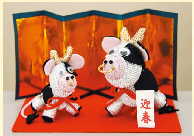
▲デイサービス利用者の方の手作り干支(丑)