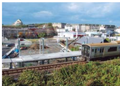
▲開業に向け整備が進むホーム・広場