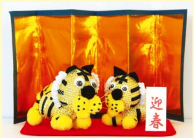
▲デイサービス利用者の方の手作り干支（寅）