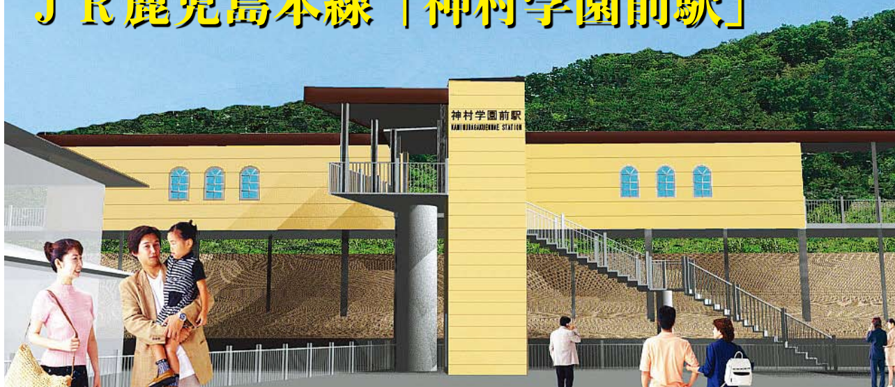
※図は駅のイメージです。

串木野駅と市来駅の間に建設中の新駅が、「神村学園前駅」として今年3月13日(土)に開業することが決まりました。