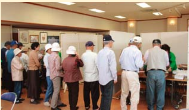
▲プレミアム付き商品券販売風景

このような中、本市においては、景気対策として、 商工会議所及び商工会の皆様方のお力添えのもとに プレミアム付商品券を販売することができました。