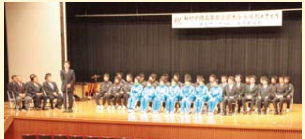
▲神村学園高等部男子サッカー部及び女子駅伝部壮行会

スポーツでは、多くの明るい話題がありました。 神村学園が、春の選抜甲子園や全国サッカー選手権 に出場し、都大路の女子駅伝では4位入賞、中部部 女子ソフトボール部は史上初の全国4連覇を達成す るなど、本市の名を全国に広めるとともに、私たち に夢とさわやかな感動を与えてくれました。ほかに もレスリングや弓道、陸上など様々な競技において、 市民の皆様が全国レベルの活躍をされ、誠に喜ばし いことでした。