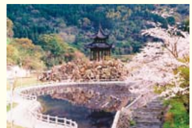
▼冠岳花川砂防公園

この機会を生かし、いちき串木野市の魅力を精一杯アピールしていきたいと思っておりますので、市民の皆様への応援を御願いたします。