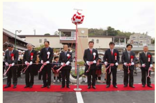
▲神村学園前駅開業式

神村学園は、昨年も駅伝、サッカー、ソフトボール、マーチングバンド・バトントワリングなど全国大会で優秀な成績を収めました。また、陸上、珠算など様々な全国レベルの大会において、市民の皆様が活躍され、誠に喜ばしいことでした。