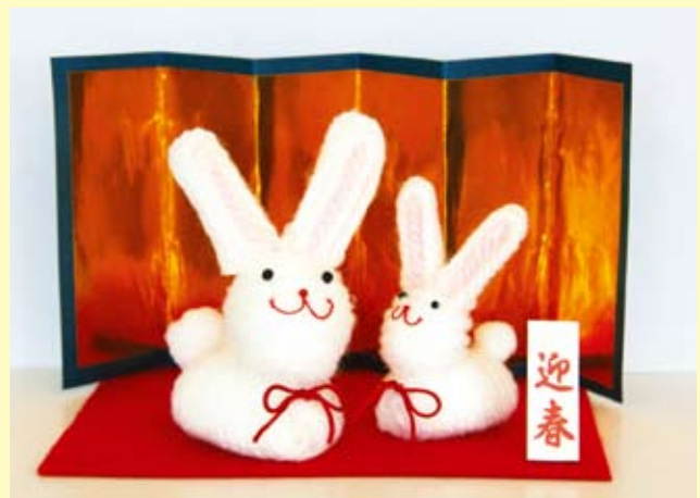
▲デイサービス利用者の方の手作り干支（卯）