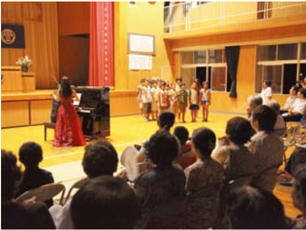
▲森の保育園サマースクールの様子

もたちとの交流が行われ、喜ばれました。今後も短期スクールの実施が予定されています。