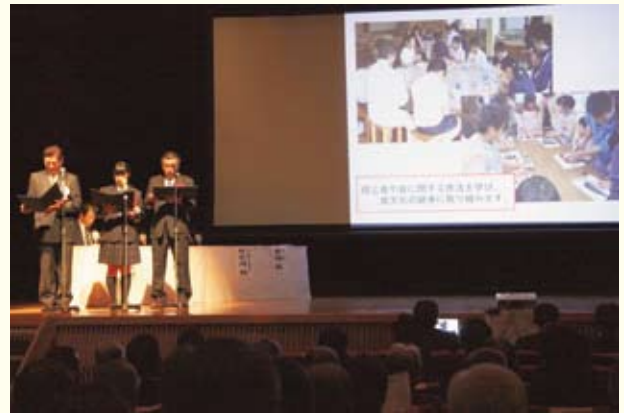
▲食のまちづくり宣言の様子

ました。式典が多くの方の市民の皆様の参加により盛大に開催でき、5周年を祝うとともに、未来に向け出発できましたことを心より厚く御礼申し上げます。