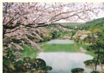
▲観音ヶ池市民の森

昨年末には、霊峰冠岳の麓に新たに温泉施設がオープンしました。市来ふれあい温泉センター、羽島白浜の温泉とともに、ちかび展示館、長崎鼻公園を巡り、冠岳登山や八十八カ所歩き遍路、千本桜の観音ヶ池など森林浴を楽しんだ後は、ゆっくりと温泉を楽しめる観光ルートを紹介して、本市への集客を図ってまいります。