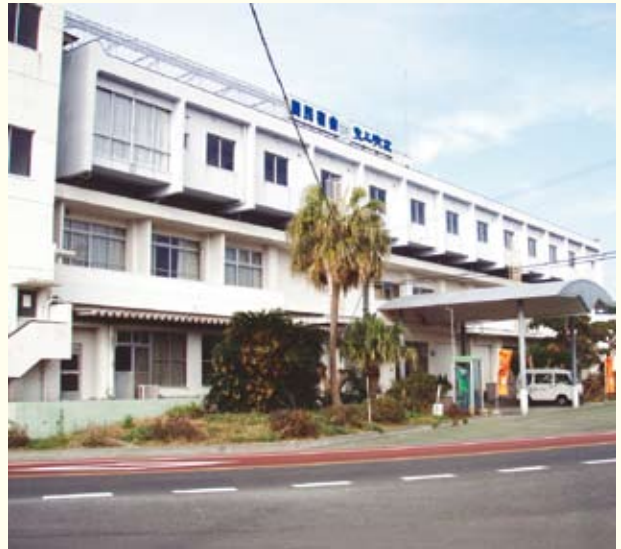
▲行政改革推進事業（指定管理者制度）

沿って進めております。平成23年度からは、新たな行政改革大綱推進計画を始めます。これまでの行革のスピードを緩めることなく、効率的で効果的な行政運営を行い、市民サービスの向上と持続可能な財政基盤の構築を図ります。