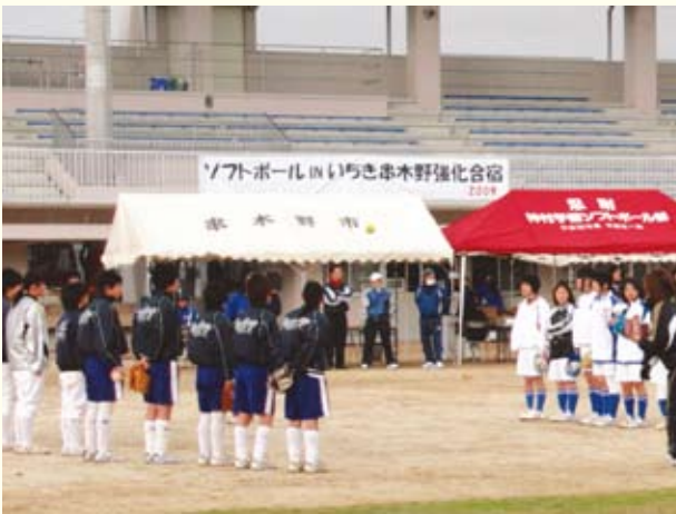
▲多目的グラウンドによるスポーツ合宿

総合運動公園については、平成3年度に基本構想を策定の上、65ヘクタールの土地を取得しました。平成7年度に陸上競技場、多目的広場、総合体育館、弓道場、野球場、テニスコート、プールなどの施設を含む基本計画を策定しました。これに基づき、平成14年度に多目的グラウンド、平成18年度に管理棟兼スタンドを整備しましたが、国・地方全体の財政悪化が進み、本市の財政状況においては、計画の全てを実現することは困難となりました。このため計画を見直し、総合体育館、テニスコートについては、市で整備することとし、他の施設整備予定地については、運動施設等への利用を条件とした公売等により、民間活力の活用を図ってまいりたいと考えております。