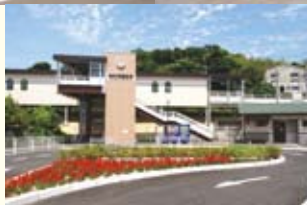
▲JR鹿児島本線 串木野駅・神村学園前駅・市来駅

さつまあげ発祥の地であり、遠洋マグロ漁船数日本一を誇る「食のまち」として情報発信に努め、まぐろラーメン、マグロカレー、マグロハイカラ揚げ（から揚げ）のほか、ポンカンを使ったポンカレー、地元食材を使っ