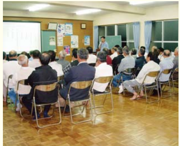
▲市政報告会の様子

しかしながら、本市は、原子力防災対策重点区域の10km圏内に羽島・荒川地区が含まれるなど、立地市とほぼ同じ環境にあることも踏まえ、安全確保や情報開示、防災対策、地域振興策等について国、県、九州電力に対し、強く要請いたしました。これからも、市民の皆様の安心・安全の確保に努めてまいります。