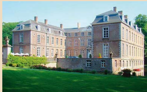
今も遺るインゲルムンステル城

しかし、残念ながら財政的理由や対英親善の施策という薩摩藩側の理由からベルギー商会設立の本契約締結には至りませんでした。