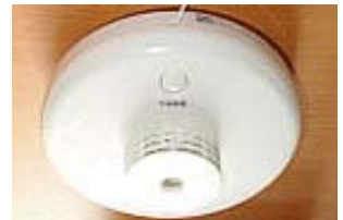
住宅用火災警報器