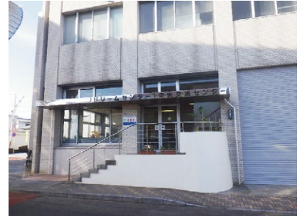
ドリームセンター外壁等維持補修事業