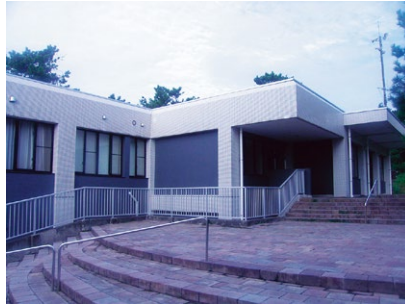
申木野健康増進センター屋根防水維持補修事業