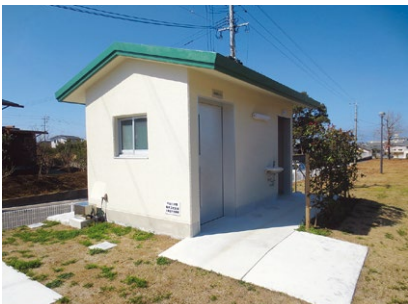
権現下公園トイレ整備事業