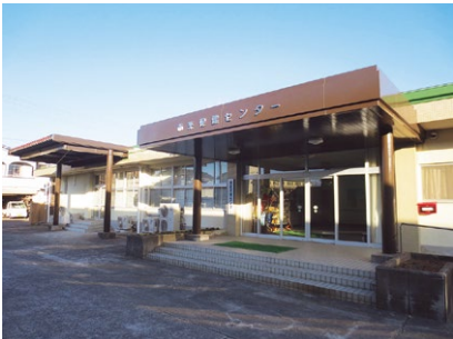
市来保健センター屋根防水等維持補修事業