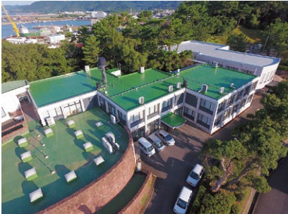
申木野高齢者福祉センター等屋根防水・外壁維持補修事業