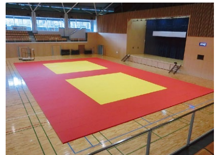
総合体育館施設整備事業