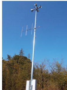
防災無線拡声子局整備事業