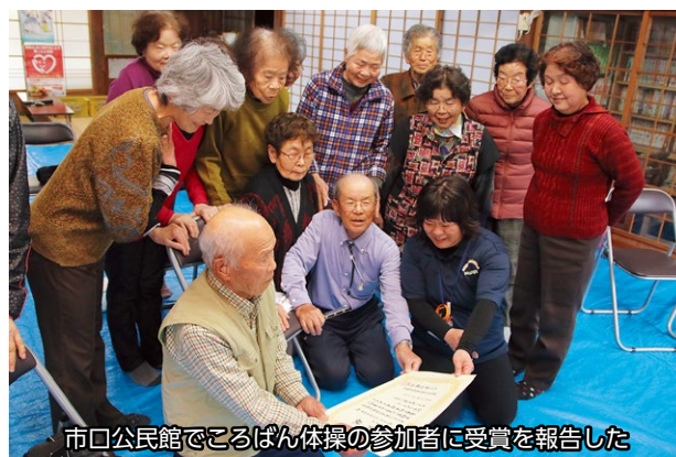
市口公民館でころばん体操の参加者に受賞を報告した

ゆっくりと無理のない筋力トレーニングで介護予防を図る「ころばん体操」の取組が、日本公衆衛生協会衛生教育奨励賞を受賞しました。