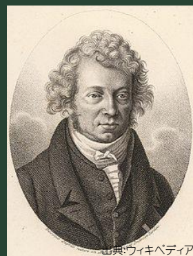
André-Marie Ampère (1775～1836) アンドレ＝マリ・アンペール →今回は でんきの単位シリーズ③ 「ボルタさん」のおはなし

電気の流れる量=電流を表す単位が(A)アンペアです。家庭では20Aや30Aなど、ご使用状況にあわせ契約を選ぶことができます。