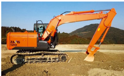
最終処分場整地作業車整備事業