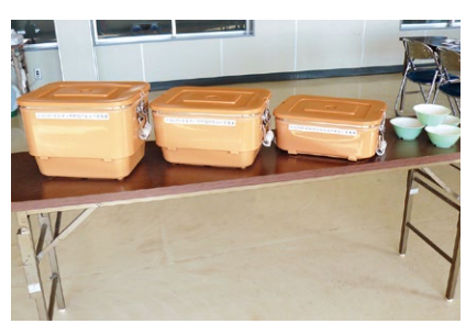
学校給食センター温食缶等整備事業