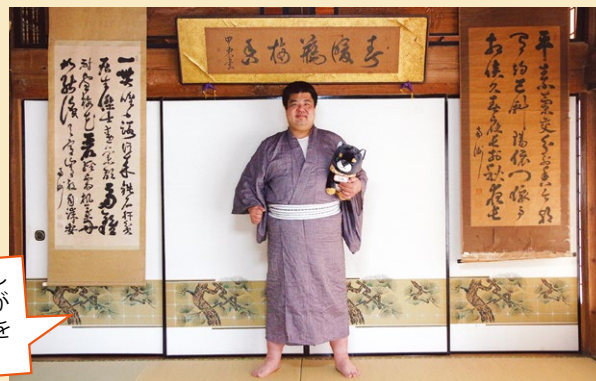
左から順に、西郷、大久保、西郷の書として加藤家に伝わっている書