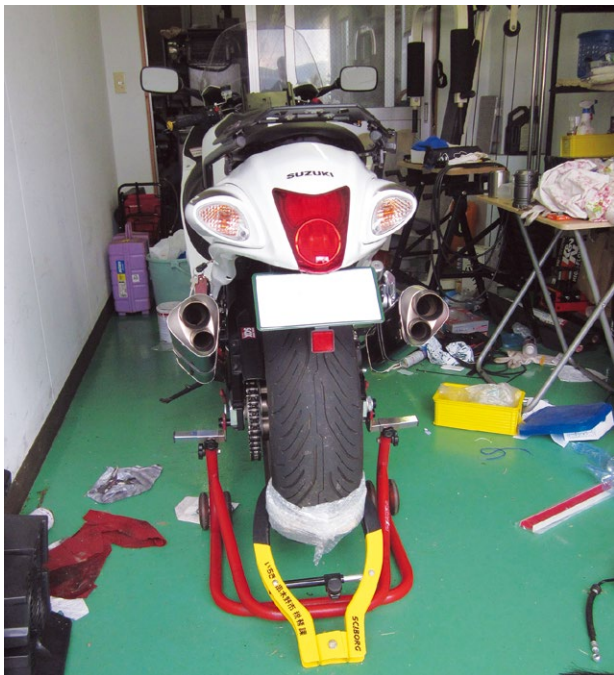
自動二輪のタイヤロック

※2 日常生活に不可欠な衣服や家具など、法律で差押えが禁止されているもの以外のもので、テレビ等家電製品、腕時計等生活用品など。