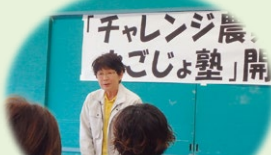
2人の女性農業委員さんからも 激励の言葉をいただきました！