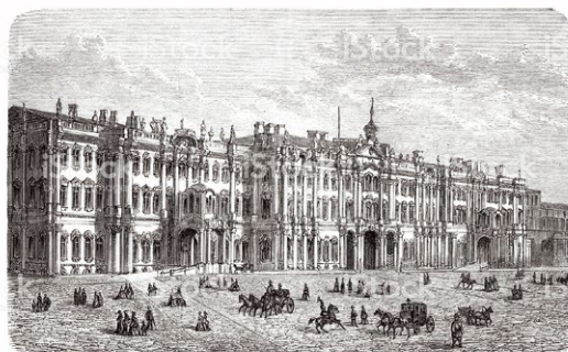
サンクトペテルブルグの風景 (19世紀)