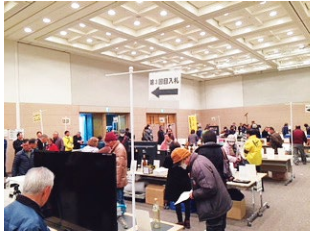
県・市町合同公売会（平成30年1月実施）

滞納処分として差押えた動産や不動産は、インターネット公売、県・市町合同公売会、不動産公売会等で公売され、その代金は滞納している税金に充てられます。