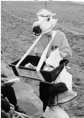
※ばふーん饅頭は馬に扮した売り子が移動販売いたします。