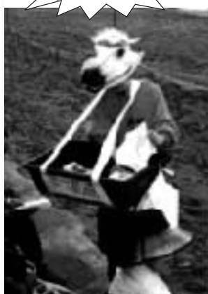
ばふーん饅頭は馬に扮した売り子が移動販売いたします。