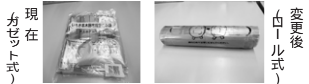
現 在 ガ ゼ ッ ト 式

本年度から、指定ごみ袋が『ガゼット式』から、『ロール式』へ変更になります。 変更となる時期は、現在の在庫がなくなり次第ですが8月以降になる予定です。