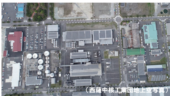
(西薩中核工業団地上空写真)

問合せ(委託事業者) カーボンフリーネットワーク(株) ☎022-281-9320