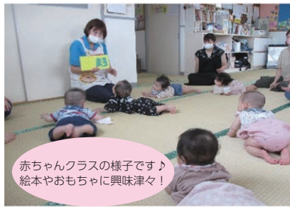
赤ちゃんクラスの様子です♪ 絵本やおもちゃに興味津々！