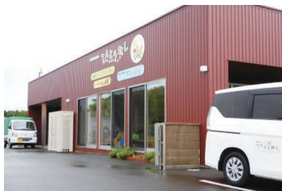
特定非営利活動法人 てんとうむし

協定締結により、市の福祉避難所は11施設となり、要配慮者の安全安心な避難生活のための環境整備の充実が期待されます。