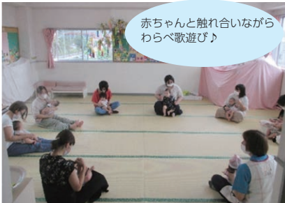
赤ちゃんと触れ合いながらわらべ歌遊び♪

ベビーマッサージ・産後シェイプアップ体操教室(年6回)・ベビードダンス(年3回)・ベビースキン講座・キッズビクス&親子からだ遊びなど年間様々な講座を開催しています。(市のおしらせ版や支援センターの毎月のお便りで案内しています。)