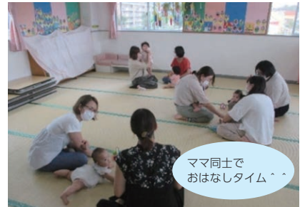
ママ同士でおはなしタイム^^