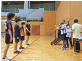
一般 A 級