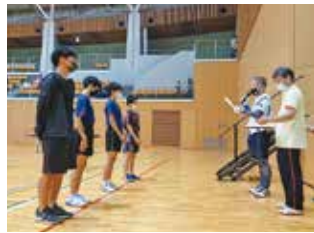
一般 B 級