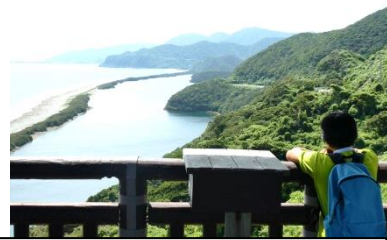
こしき島の名所長目の浜