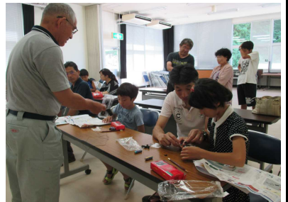
「ラジオ組み立て」に挑戦