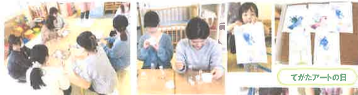
てがたアートの日