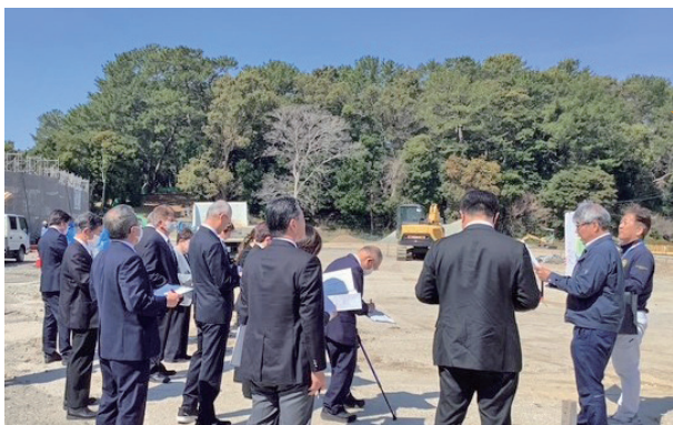
現地調査：長崎鼻公園

継続費設定による長崎鼻公園の再整備を進めるほか、大型斜面遊具・屋外トイレ・駐車場の整備を行います。