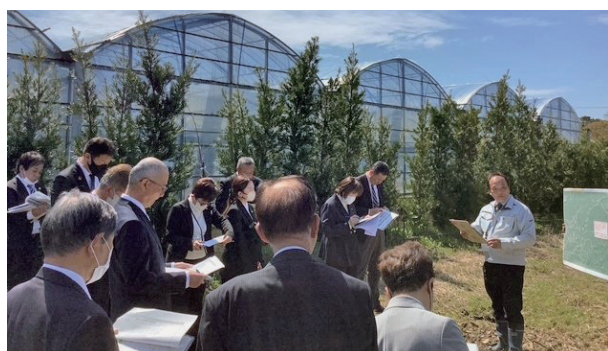
現地調査：シトラススクール(中井原)

新たに地域おこし協力隊を活用した育成プログラム「柑橘就農シトラススクール」を設置して、後継者が見込まれない園地を経営する柑橘農家を育成し、持続的な産地の維持・拡大を図ります。