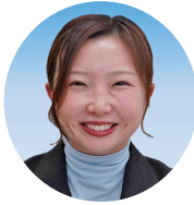
竹中 ひかり 議員