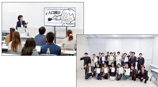
令和7年度ローカルチャレンジ塾

※令和8年度は、地域ビジネス等に活用できるデジタルスキルやDX、SNSマーケティング等の座学を合計10回の開催と地域課題を題材にしたフィールドワークを実施する計画です。