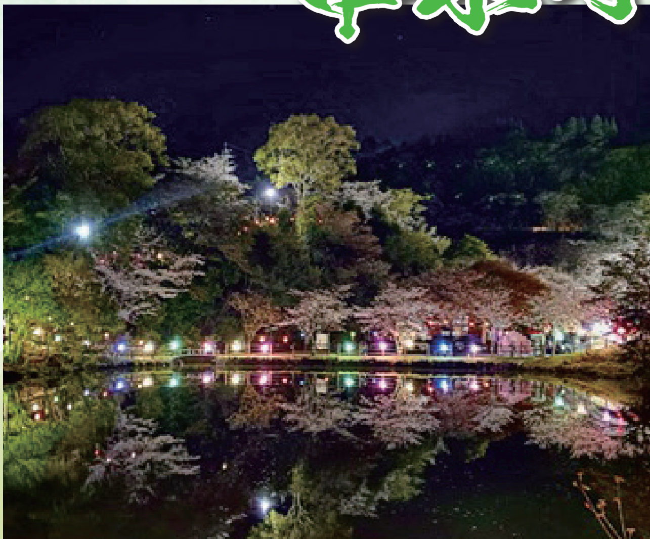
観音ヶ池夜桜ライトアップ