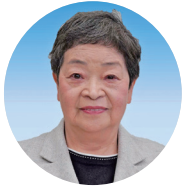
江口 祥子 議員