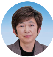
西 美香 議員

答 中学校再編で得られた課題や反省点を十分に踏まえ、情報提供をより丁寧に行い、保護者や地域住民の意見を収集し進めていく。令和8年1月に実施した保護者アンケート結果を分析し、その内容を基に地域との意見交換会を計画している。