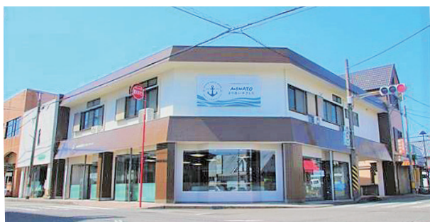
MINATOよりあいオフィス (元町)

市街地に整備したサテライトオフィスへIT企業を誘致し、新たな雇用の場を確保して若年人口の流失を抑制します。併せて、コミュニティマネージャーを配置して、誘致企業と地元企業とのマッチングを行い、生産性向上などの課題解決を図りながら、新たなビジネスモデルを構築し、地域の活性化につなげます。