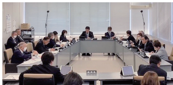
予算審査特別委員会

問 座学やフィールドワークの受講により能力を高めた人材が、市外へ流出しないよう、ハローワークと連携していくことが必要ではないか。