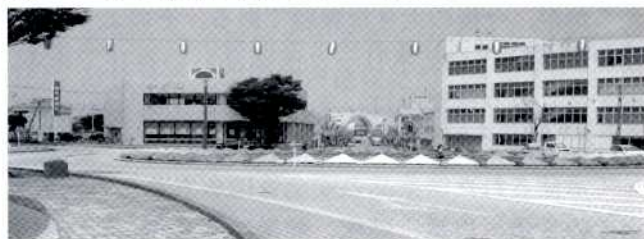
旭町ロータリーの周辺

答 施設整備費用及び発行委託料の費用対効果の面から非常に厳しい。串木野庁舎、市来庁舎、羽島出張所での証明書発行業務、そのほか郵便輸送、休日、時間外交付業務体制で今後も進めていく。