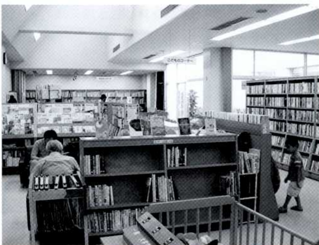
市民文化センターに隣接する市立図書館