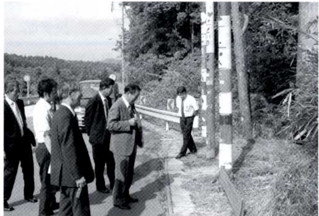
不法投棄の防止のために設置されたトータムポール

ごみの減量化に向け、分別収集のほか不用品の再利用を促進するためのフリーマーケット開催等に取組んでいた。さらに、エコショップ認定制度をスタートさせ、市民が3R（リデュース・リユース・リサイクル）の取り組みを自主的に行っている販売店を審査するとともに、市民が3Rについての意識を高めるための取り組みが始められていた。