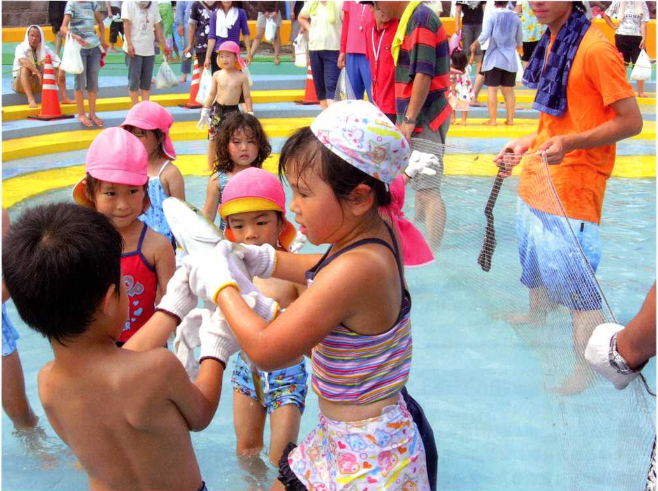
長崎鼻海水プール開き 15ページに写真の説明