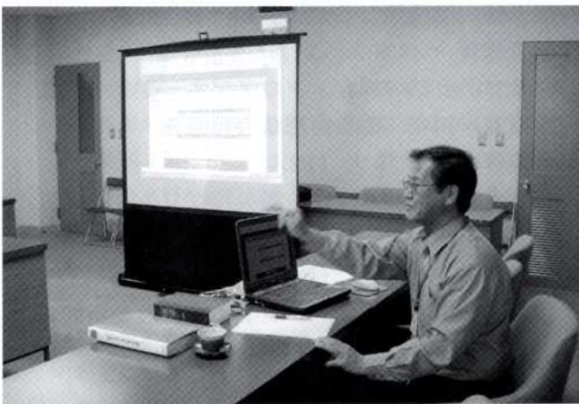
パソコンを使いながら入札制度改革の説明をする職員

入札制度改革の取組みとして、平成13年6月に当時の市長(現三重県知事)が、入札制度検討会議立上げの記者発表を行い、7回の入札制度検討会議を経て、平成14年4月からこれまでの指名競争入札を全面的に廃止し、条件付き一般競争入札(郵便入札)を導入した。