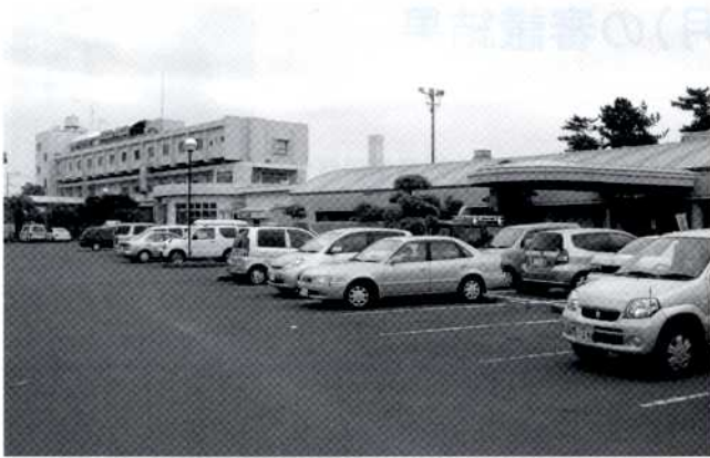
国民宿舎吹上浜荘と市来ふれあい温泉センター