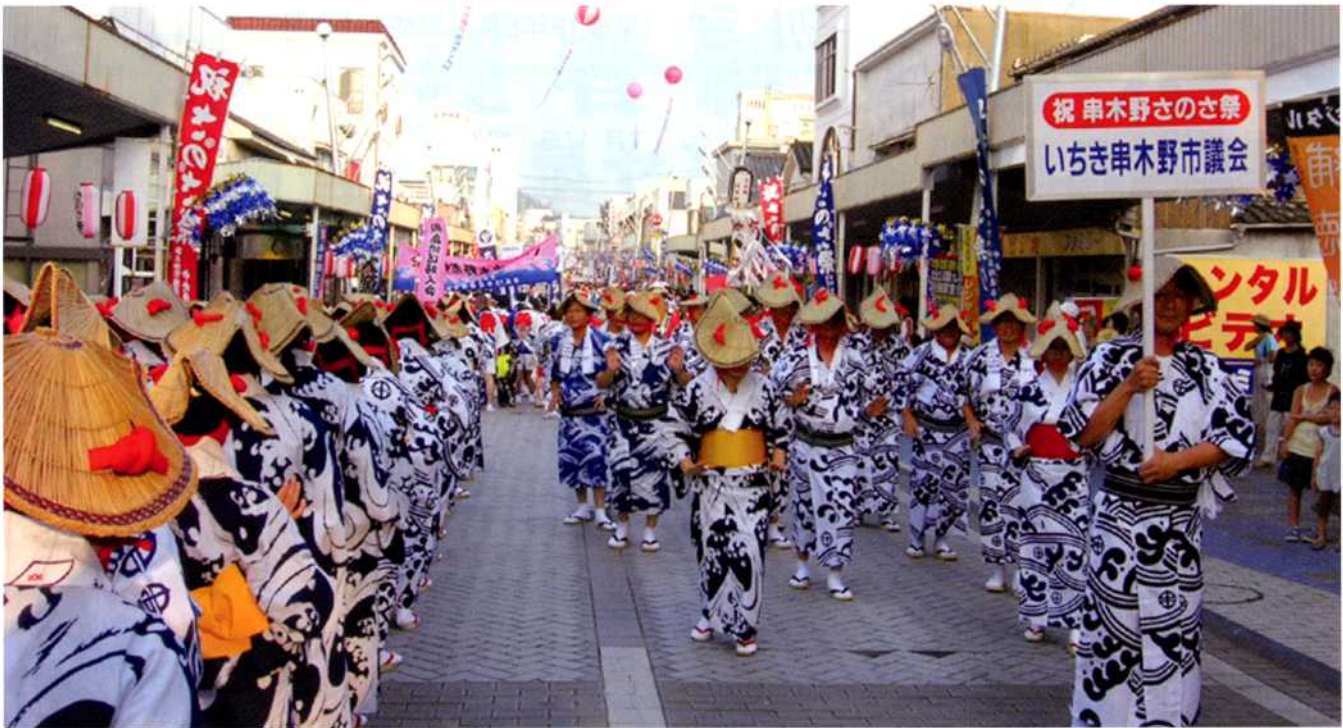
7月29日開催のさのさ祭り市中流し踊り