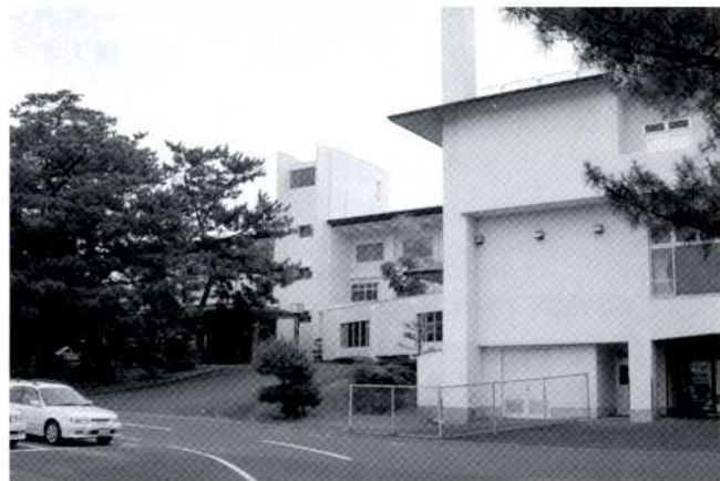
国民宿舎串木野さのさ荘

指定管理者制度を導入するため、現行の串木野さのさ荘条例及び吹上浜荘条例は廃止し、新たに国民宿舎条例として統合するもので、市来ふれあい温泉センター条例は、条文整備も含め、全部改正を行うものです。