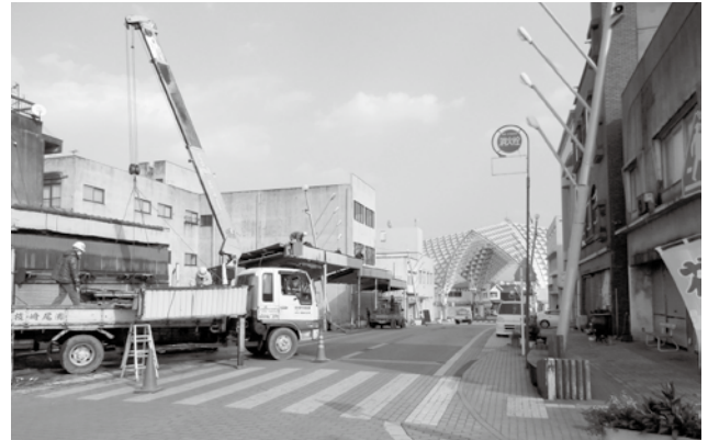
撤去される串木野中央通り会アーケード

串木野中央通り会がアーケード撤去のために実施する商店街まちづくり事業に対する補助金でアーケードの撤去 380 メートルと、アーケード取り付け部分の補修への補助金。