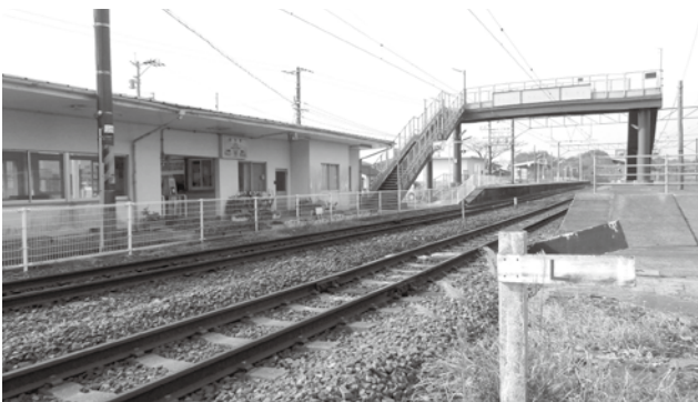
バリアフリー化される市来駅

答 同様に整備される東市来駅や湯之元駅等の動向を見ながら、人的な対応も視野に入れ、安全対策に十分留意する。