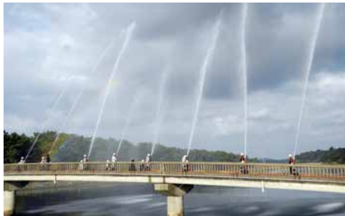
消防団による放水訓練の披露