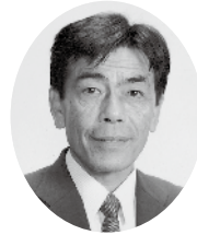
中村 敏彦 議員