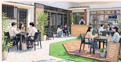
※会場イメージ(MINATOよりあいオフィス2階テラス)

いちき串木野市で厳選された スペシャルティコーヒーを自家焙煎で 提供する、 ケントコーヒー が MINATOよりあいオフィスにやってきます! 美味しいコーヒー片手に好きな席で お過ごしてください。