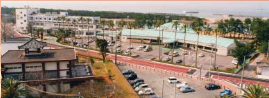
(市来ふれあい温泉センター)