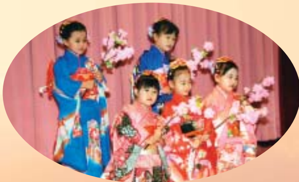
(おゆうぎ会の様子【市来保育所】)

(多目的グラウンドの利用促進・スタンドの建設、スポーツを通じた生涯学習・青少年育成等)