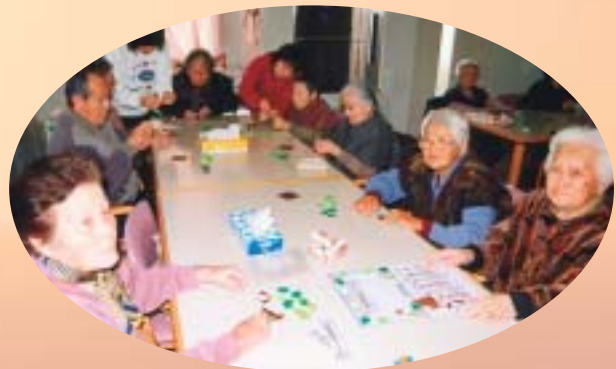
(デイサービスのみなさんによるカレンダー作りの様子)