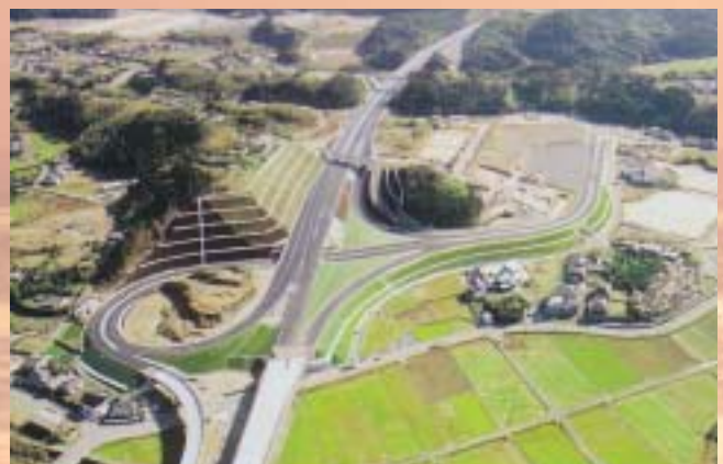
(串木野インターチェンジ)