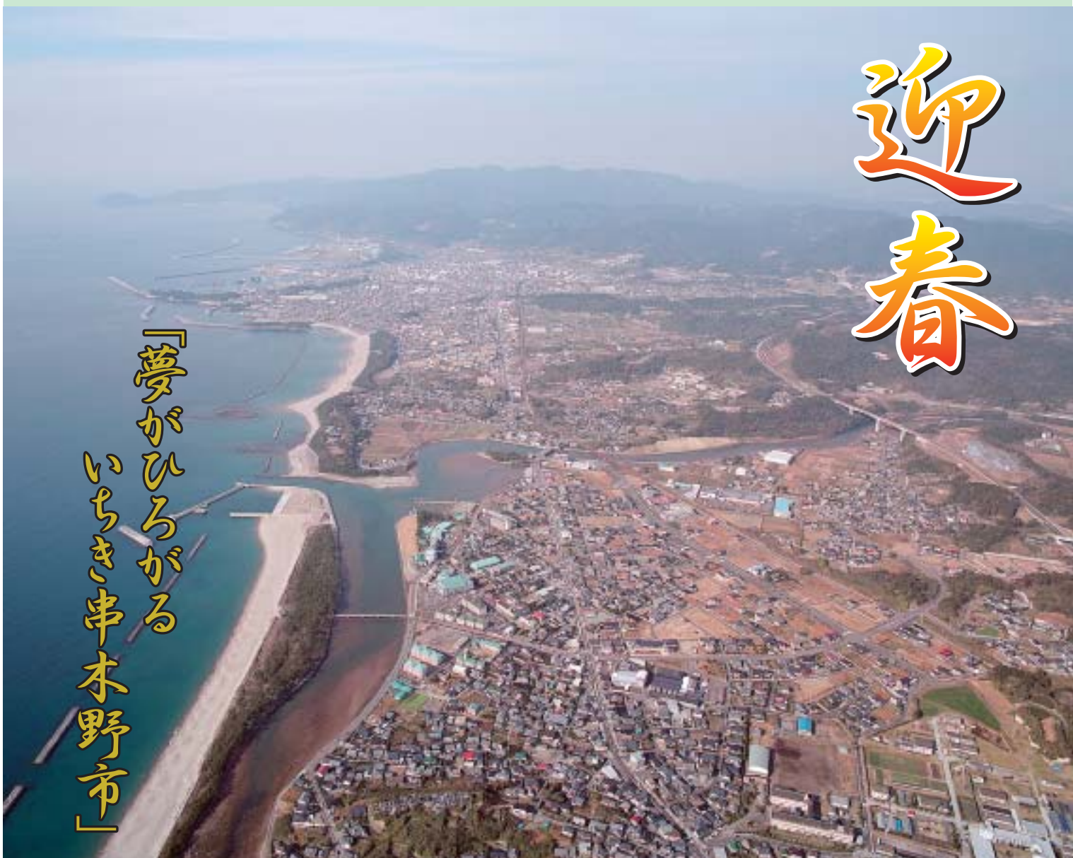
(空から見た『いちき串木野市』)