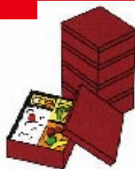
地域の運動会やスポーツ大会への飲食物の差入