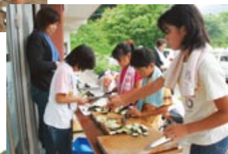
▲上手な包丁さばきです