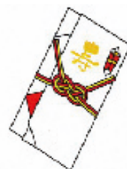
秘書等が代理で出席する場合の結婚祝