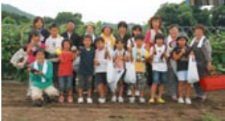
▲参加者全員で記念撮影

7月28日、生活研究グループが主催する農業体験型バスツアーが行なわれました。これは生産者や野菜、地域そのものが教材となり、農業体験や調理実習を通して食と農の大切さを学び、食を通して地域の特徴、魅力を再発見してもらおうと計画されました。