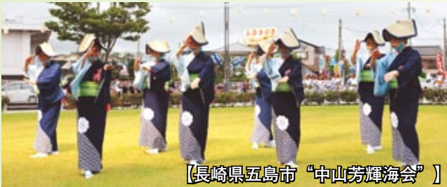
【長崎県五島市“中山芳輝海会”】