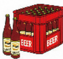
町内会の集会や旅行などの催物への寸志や飲食物の差入