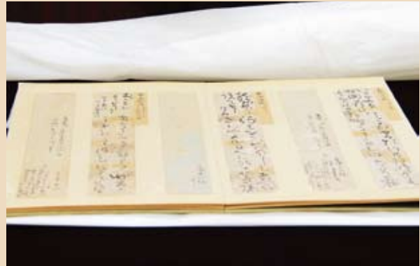
▲資料の一部「和歌短冊」

10月25日、幕末の1865年に薩摩藩英国留学生在羽島から英国に向けて旅立つ際に詠んだ和歌（6首）と漢詩（1句）の短冊を報道関係に公開しました。