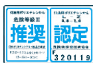
推奨・認定マーク