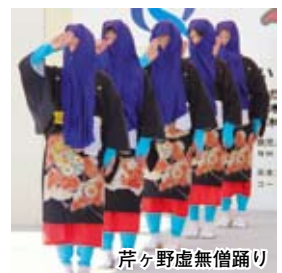
芹ヶ野虚無僧踊り