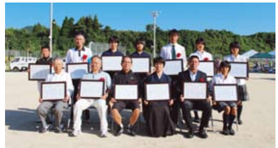
平成25年度体育協会表彰も開会式で行われました。