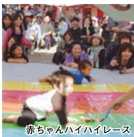
赤ちゃんハイハイレース