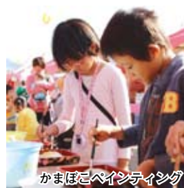
かまぼこペインティング