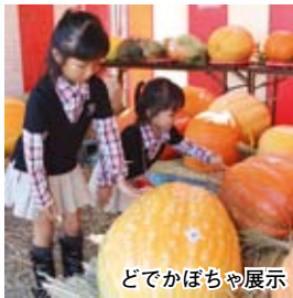
どでかぼちゃ展示