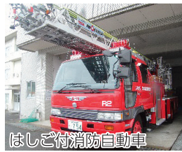
はしご付消防自動車