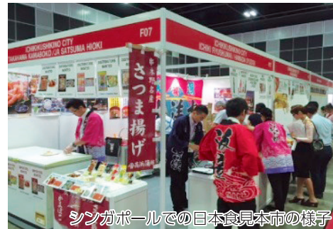
シンガポールでの日本食見本市の様子

本市の特産品の消費拡大を図るため、シンガポール等で開催される日本食見本市への出展費用に対する助成などを行い、市内業者の海外販路開拓を支援します。