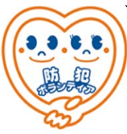
防犯ボランティア シンボルマーク

最寄りの警察署・#9110(警察総合相談窓口)24時間OK 188【イヤヤ】(消費者ホットライン)