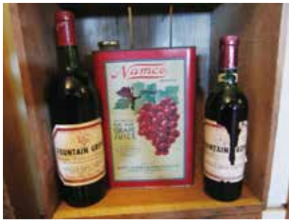
ファウンテングローブのワインとグレープジュース

そして、このファウンテングローブのワインは、イギリスやフランスなど、ヨーロッパでも通用するほどのカリフォルニア・ワインとなるのでした。