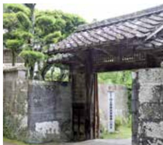
旧入来邸武家屋敷