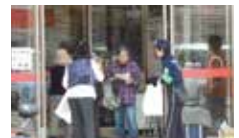
うそ電話詐欺被害防止・消費者月間キャンペーンの実施