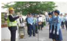
神村学園女子駅伝部員が交通安全宣言

国道3号で「旗の波」により交通事故防止を喚起後、出発式では運転免許返納者への卒業証書授与や交通・地域安全関係表彰、一日警察署員として神村学園女子駅伝部員が「交通安全宣言」を行い、パトカー・青パトなどの防犯関係車両が広報出発しました。