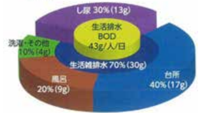
■生活排水の分類と1日1人当たりの負荷割合