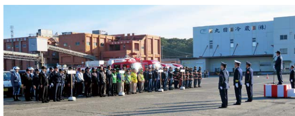
関係機関合同出発式