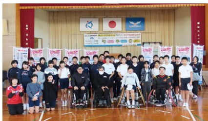
羽島小学校(5,6年生) 羽島中学校(1,2年生)