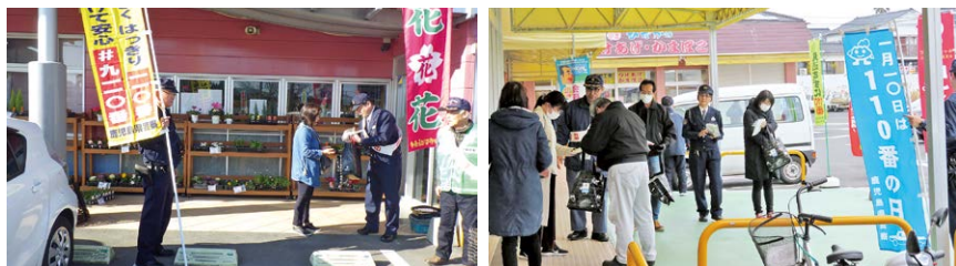
「110番の日」キャンペーン