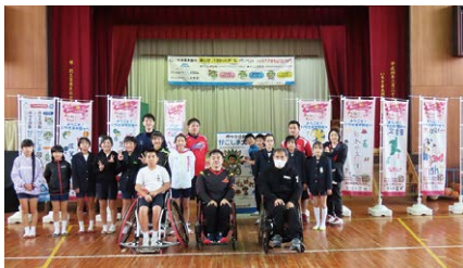
生福小学校(6年生) 冠岳小学校(5,6年生)

体験教室を通して、競技の魅力や楽しさを学ぶとともに、両大会への興味・関心も高まったようです。