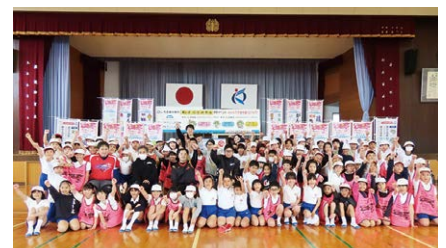
串木野小学校(4年生)