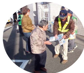
うそ電話詐欺被害防止 キャンペーン