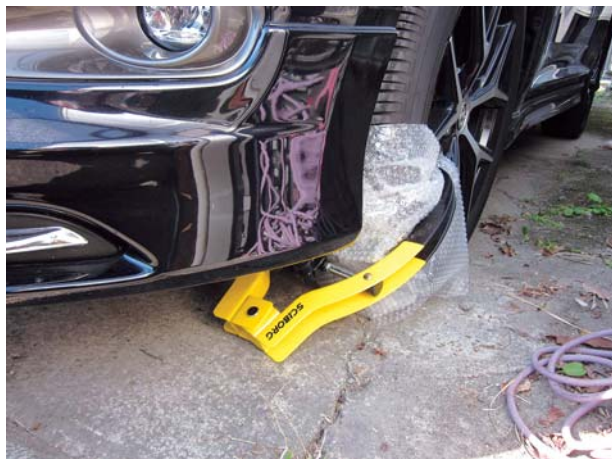
写真：タイヤロックした車両

滞納処分として差押えた動産や不動産は、インターネット公売、県・市町合同公売会、不動産公売会等で公売され、その代金は滞納している税金に充てられます。