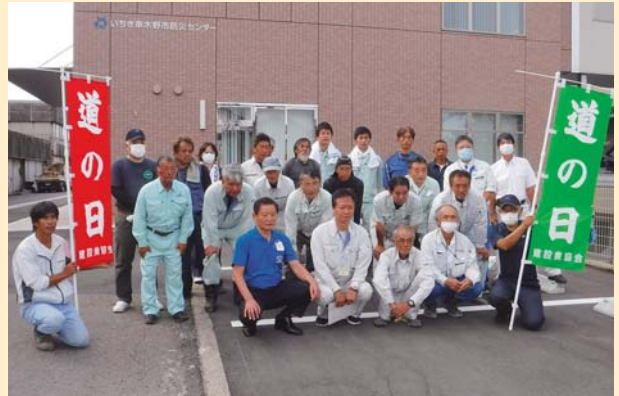
串木野建設業協会