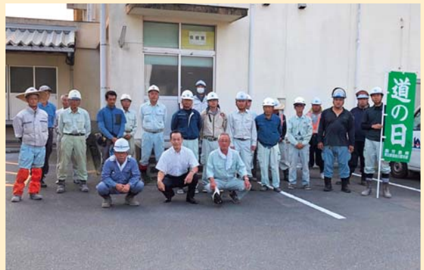
市来建設業互助会

8月7日、串木野建設業協会及び市来建設業互助会から約50名の会員が参加し、ボランティア活動で市内の道路を清掃しました。