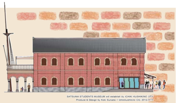
SATSUMA STUDENTS MUSEUM will establish by ICHIKI KUSHIKINO CITY

博物館、美術館等を訪れた際に、併設されている売店を覗いてみるのも楽しみの一つではないでしょうか。当館の売店「羽島屋」にも、地元企業の商品をはじめ羽島の方々の手作りの工芸品や、ここでしか買えないTシャツやマグカップ、ピンバッジ等々のオリジナルのグッズを扱っています。先日、記念館オリジナルのフラットデニムポーチとトートバッグの2点加わり、大変好評を頂いています。