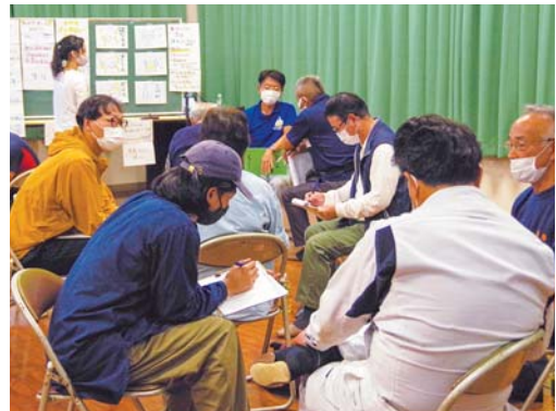
地域住民も「よそ者」も一緒に活動する「よりみち会議」

私たち「えんたく」は、文化村の取組をとおして「関係人口」を増やすきっかけを作っていく、元気な地域を創るお手伝いをしていきたいと思っています。