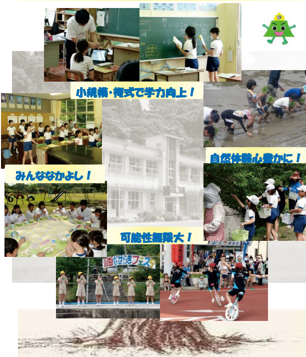
小規模・複式で学力向上！