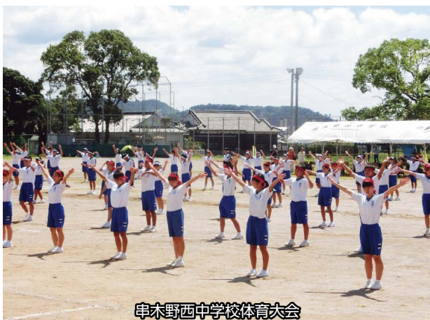
串木野西中学校体育大会