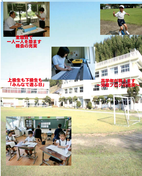
全職員で 一人一人を励ます 機会の充実