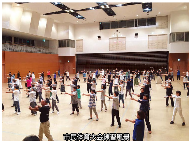
市民体育大会練習風景

2020年に開催される、燃ゆる感動かごしま国体・かごしま大会をPRする「ゆめ～KIBAIYANSE～ダンス」に様々な団体が取り組んでいます。