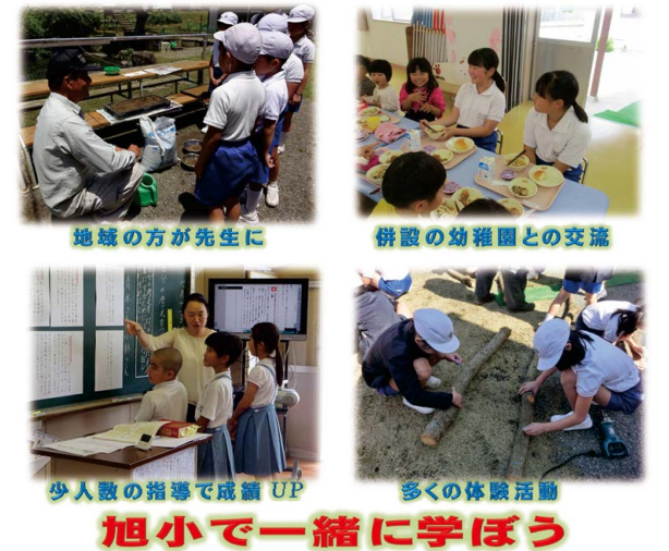
地域の方が先生に