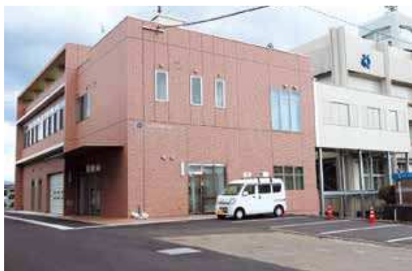
災害時の拠点施設 防災センター

4月には、串木野庁舎東側に災害時の拠点施設となる「市防災センター」が開所しました。耐震強度は通常の1.5倍で、自家発電設備を備えています。市では、完成した防災センターにおいて、防災に関する情報を集約し、市民の皆様迅速かつ的確に避難情報を発信してまいります。