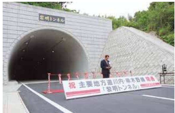
安全安心な通行を 黎明トンネル開通

5月には、主要地方道川内・串木野線に地域の皆様の念願でありました「黎明トンネル」が開通しました。黎明トンネルは、平成28年度に着手して以来、4年間をかけて整備されました。これまでの海岸沿いの道路はカーブも多く、豪雨による道路のがけ崩れ、海からの高波や強風の危険がありましたが、今後は安全安心で快適な通行が可能となります。トンネルを抜けると、海と山に囲まれた美しい風景が目に飛び込んできます。なお、トンネルの名称は、れいめい羽島協議会が命名しました。