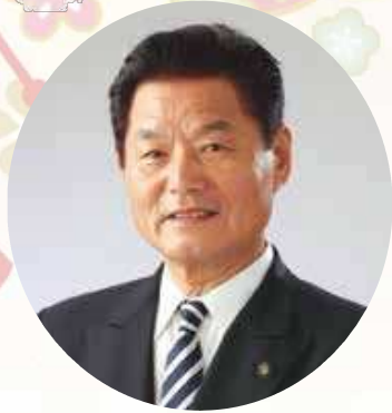
いちき串木野市長 田畑 誠一