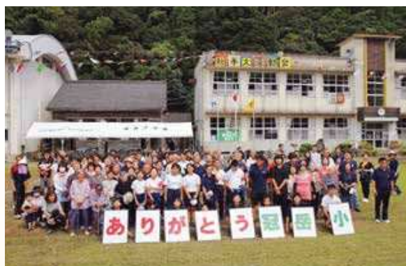
ありがとう冠岳小学校 最後の大運動会

を迎えるにあたり、地域の方々や同校の卒業生などが見守る中、7名の児童はかけっこや一輪車の競技、応援合戦などに一生懸命取り組み、参加者全員にとって、忘れられない最後の大運動会となりました。