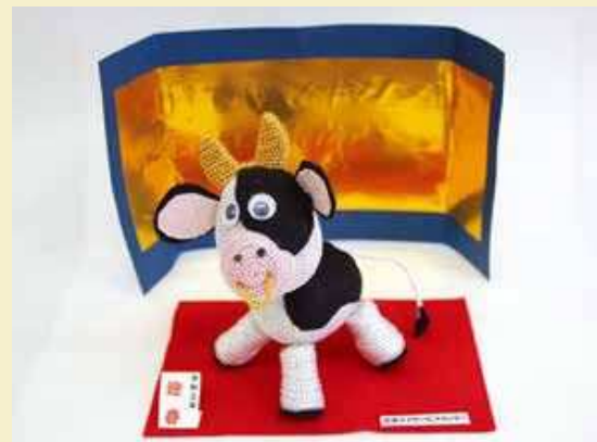
▲市来デイサービスセンター利用者の方の 手作り干支(丑)