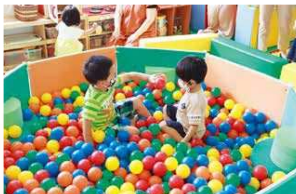
乳幼児・保護者の交流の場として 子育て支援センターきらきら

令和3年を迎え、未来を見据えたまちづくりをさらに進めていかなければならないと、決意を新たにしております。本市は、昨年11月末の住民基本台帳人口が2万8千人弱となっており、人口減少を少しでもくい止めるため、「まち・ひと・しごと総合戦略」に基づき各種施策を実施しておりますが、今後も危機感をもって、着実に取り組む必要があります。とりわけ、少子化対策、子育て支援が重要課題であります。乳児・幼児及び保護者の交流の場並びに育児に関する相談・支援の場として本市においては2か所目となる「市立子育て支援センターきらきら」を市来保健センター内に開所し、さらに、住み慣れた地域で安心して妊娠・出産・育児ができるよう、妊娠期から子育て期にわたり、保健師や助産師、臨床心理士が相談に応じ、必要に応じた支援プランを作成し、保健・医療・福祉・教育等の切れ目ない支援を行う子育て世代包括支援センター「あいびれっじ」を串木野健康増進センター内に開設したところであ