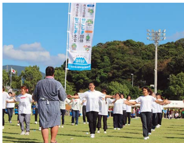
かごしま国体・かごしま大会をPR (市民体育大会)

2月には、薩摩金山蔵のトロッコ列車が30年ぶりにリニューアルしました。坑道跡を走る観光トロッコ列車としては日本で最長の700メートルであり、引き続き地域の観光振興を牽引していただきたいと思います。