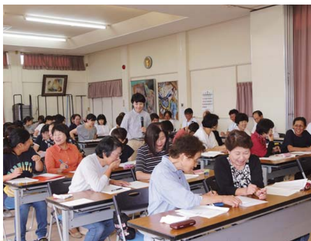
女性の声を社会へ 女性委員会

9月には、ソラシドエア社が行う地域振興プロジェクトの一環として、ラッピング飛行機「うんまか！つけあげ いちき申木野号」