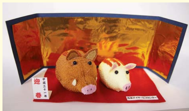
▲市来デイサービスセンター利用者の方の手作り干支(亥)