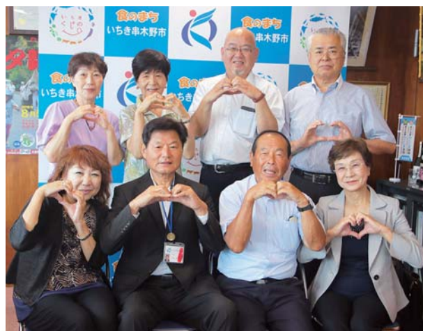
出会いをサポート 縁結び隊発足