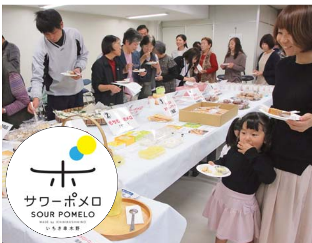
ブランド確立へ サワーポメロPR・消費拡大プロジェクト (サワーポメロスイーツ試食会の様子)

11月には、地かえて祭りが新会場で開催され、2日間で約7万8千人の方々にお越しいただきました。会場では、サワーポメロのPRと消費拡大に向けたプロジェクトの一環として、来場者投票によりサワーポメロのブランドロゴマークが決定しました。