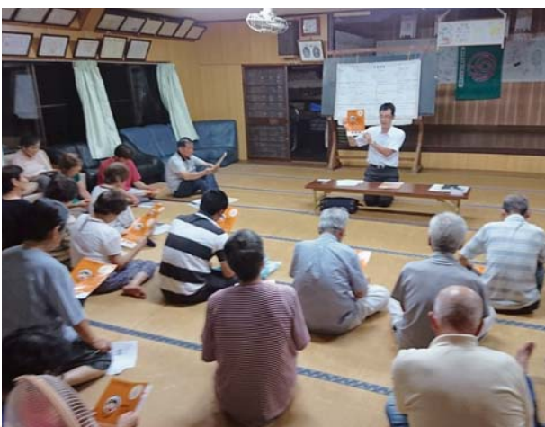
地域電力普及へ 公民館説明会

く、現在実施している事業の見直しを行い、効果の薄いものについてはそのあり方を再考すべき時でもあります。大きな時代の流れを的確に捉え、身の丈にあった「いちき串木野市」の行財政運営を確実に実行していかなければなりません。