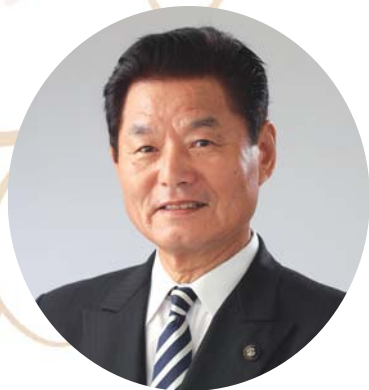
いちき串木野市長 田畑 誠一