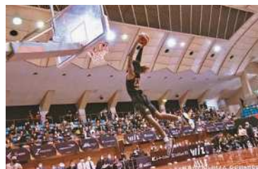
市総合体育館は、令和5年開催の燃ゆる感動かがしま国体の「少年女子バスケットボール」の競技会場です。