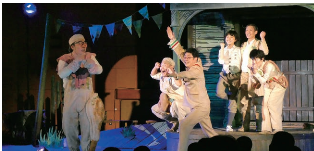
フランドン農学校の豚～注文の多いオマケ付き～