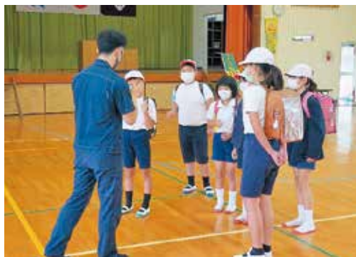
川上小での不審者対応訓練