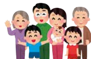
自治公民館に加入する