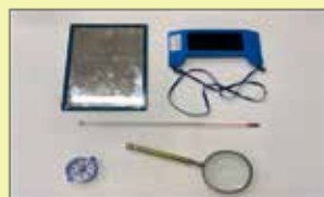
道具を自由に選ばせる