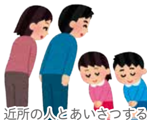
近所の人とあいさつする