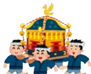
自治公民館のイベントに参加する