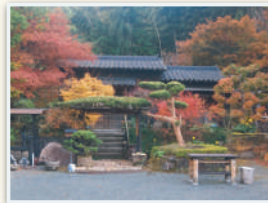
色とりどりの紅葉