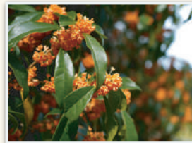
金木犀もいい香り