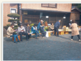
毎年行われる紅葉祭り