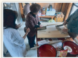
そば打ち体験もあります