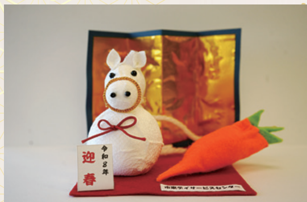
▲市来デイサービスセンター利用者の方の手作り 干支（午）